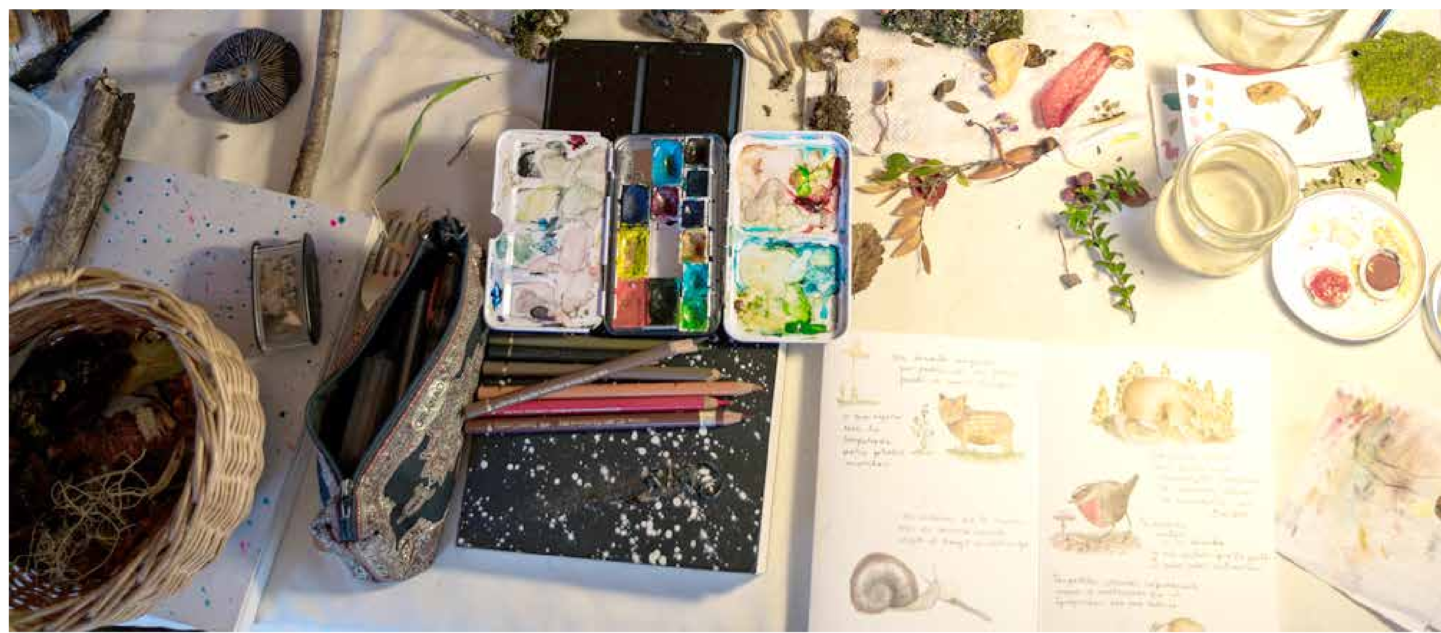
Creación de diarios